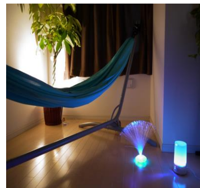
スヌーズレン・ルームの一例